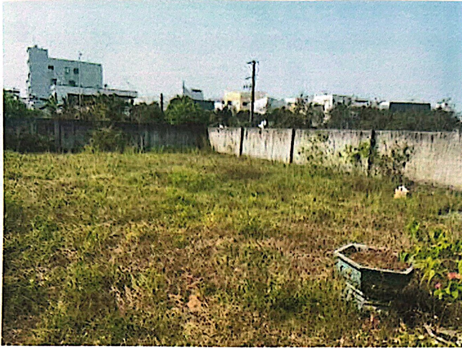
Hình 4: Hiện trạng tài sản thâm định