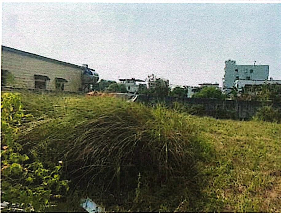
Hình 5: Hiện trạng tài sản thâm định