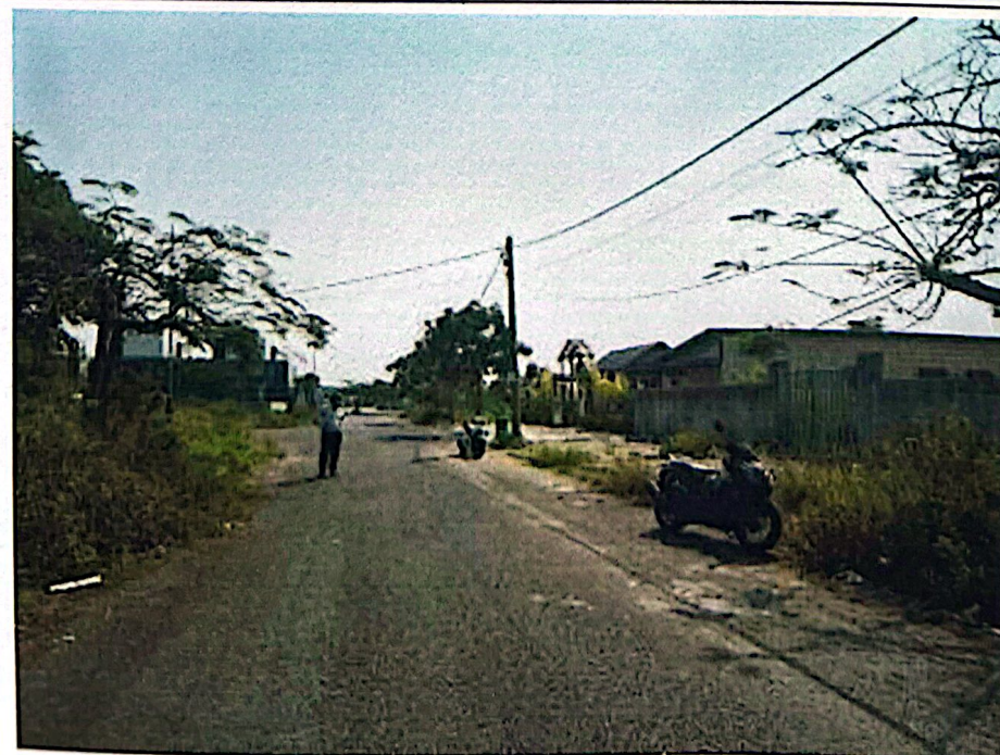
Hình 3: Đường tiếp giáp mặt tiền tài sản thẩm định